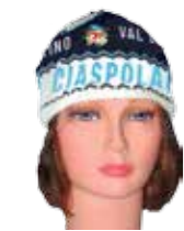
Berretto personalizzato Ciaspolada