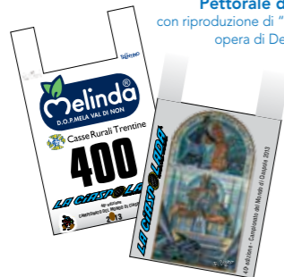
Pettorale di gara con riproduzione di "San Romedio" opera di Depero

GRANDE NOVITÀ DELLA 40ª EDIZIONE ESTRAZIONE DI UN TELEVISORE 32" TRA TUTTI GLI ISCRITTI ALLA GARA NON COM- PETITIVA!!!