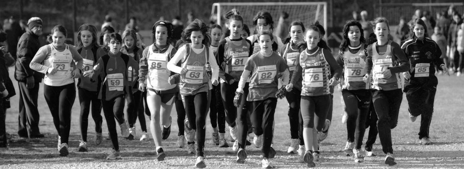
24° Cross della Valle dei Laghi 2008: partenza della gara categoria Ragazze