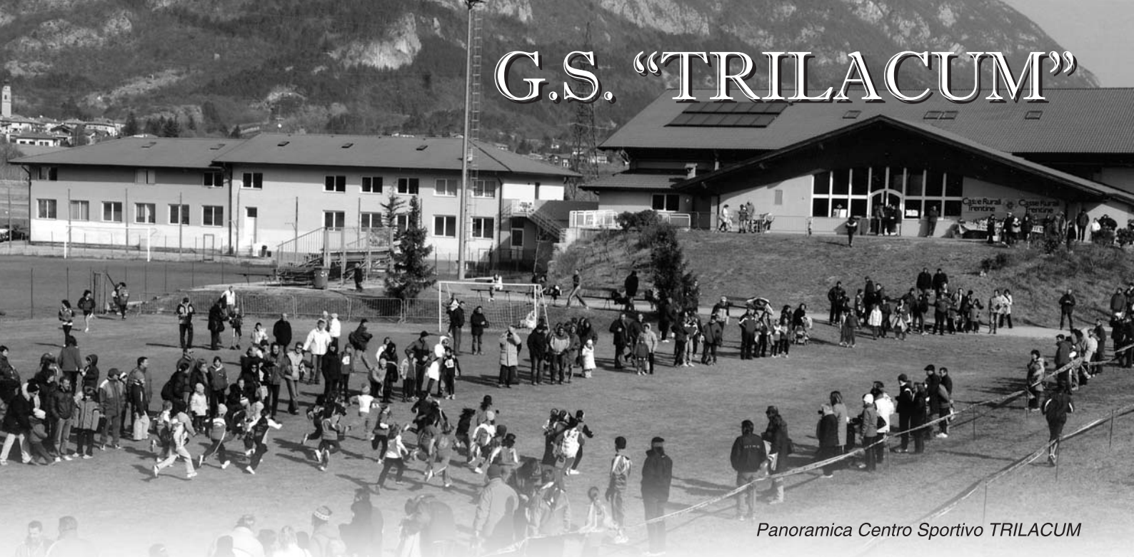
Panoramica Centro Sportivo TRILACUM