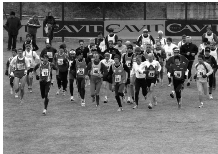
24° Cross della Valle dei Laghi 2008: partenza della gara categoria Amatori